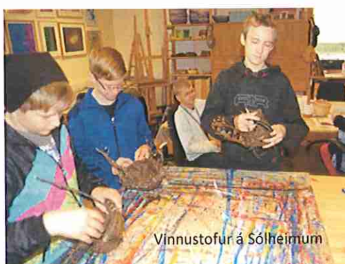
Vinnustofur á Sólheimum

Eins og fyrr segir er að finna í námskrá árganga tengingar við vettvangsferðir. Umsjónar- og greinakennarar sjá um að skrifa í námskrána hvernig kennslu í náttúrufræði og